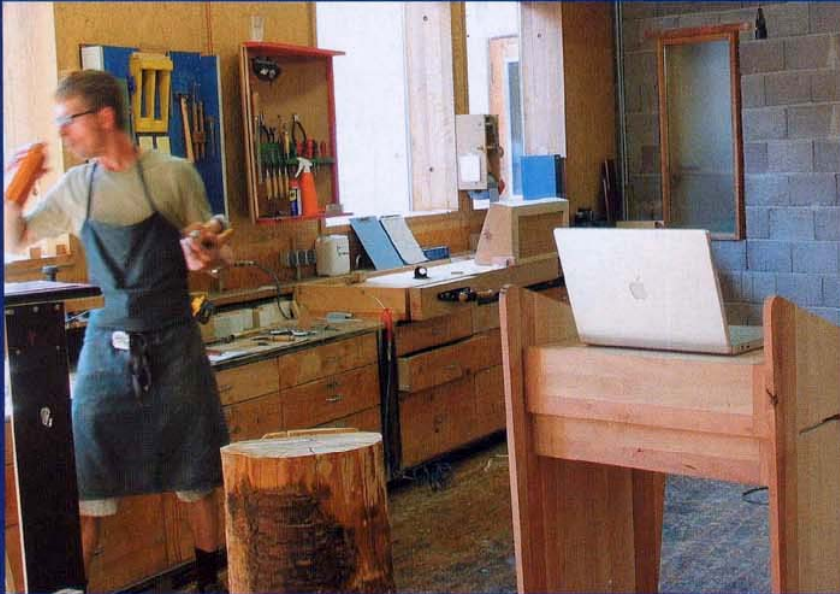
"Die Depression ging für mich unmittelbar mit der Angst einher, Verantwortung für mein Leben übernehmen zu müssen." Heute ist für H. S. wieder vieles im Fluss. Der mittlerweile selbstständige Tischlermeister und Produktdesigner hat mit seiner Firma "Hand aufs Holz" (im Bild der Künstler mit einer seiner Kreationen - dem Lese- und Arbeitspult "Hi-Desk") schon erste Erfolge zu verzeichnen.