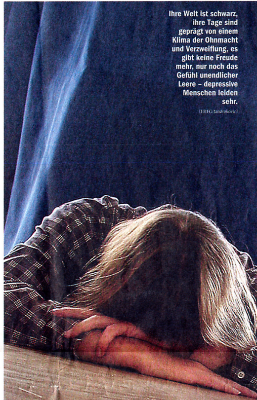
Ihre Welt ist schwarz, ihre Tage sind geprägt von einem Klima der Ohnmacht und Verzweiflung, es gibt keine Freude mehr, nur noch das Gefühl unendlicher Leere – depressive Menschen leiden sehr.

Obwohl Depressionen inzwischen zur Volkskrankheit geworden sind (25 Prozent der Frauen und zwölf Prozent der Männer sind im Laufe ihres Lebens betroffen), wird das psychische Leiden oft nicht oder sehr spät erkannt. Zum einen, weil depressive Erkrankungen oft durch unterschiedliche Symptome überlagert werden, zum anderen "ist das Interesse der Ärzte offensichtlich gering", kritisiert Kasper. "Zu einem Herzkongress kommen bis zu 25.000 Experten, an einem pulmonologischen Kongress nehmen